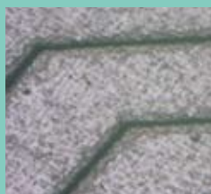
汎用樹脂へのパターン転写