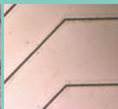
巾 10 μm 高さ 10 μm のラインを形成した微細金型